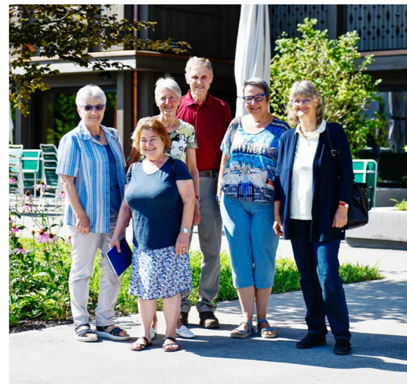
UNSERE TREUEN MAHLZEITENDIENSTFAHRER