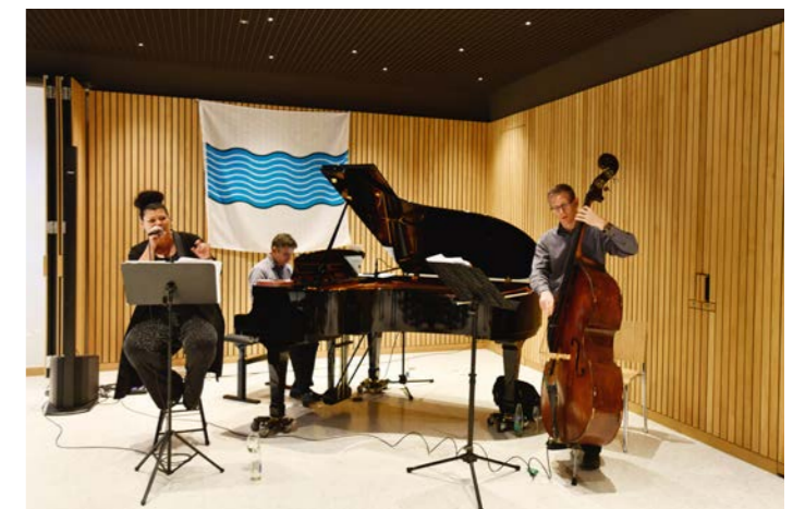
MUSIKALISCHE BEGLEITUNG DURCH «CATMOSPHERE»