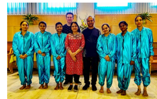
DIE INDISCHE TANZGRUPPE MIT DEM «PFAUENTANZ» AM 13. JUNI