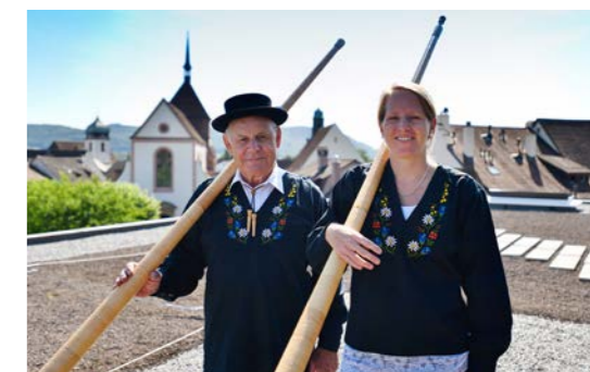
DIE ALPHORNBLÄSER AM 1. AUGUST