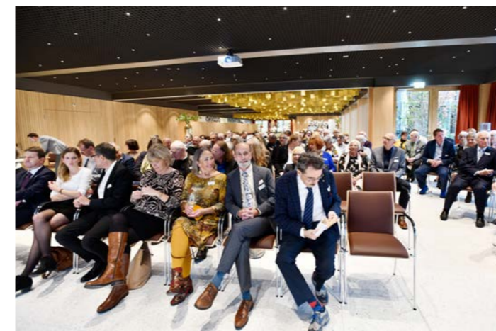
ZUM FESTAKT SEHR GUT GEFÜLLT MEHRZWECKSAAL UND BISTRO