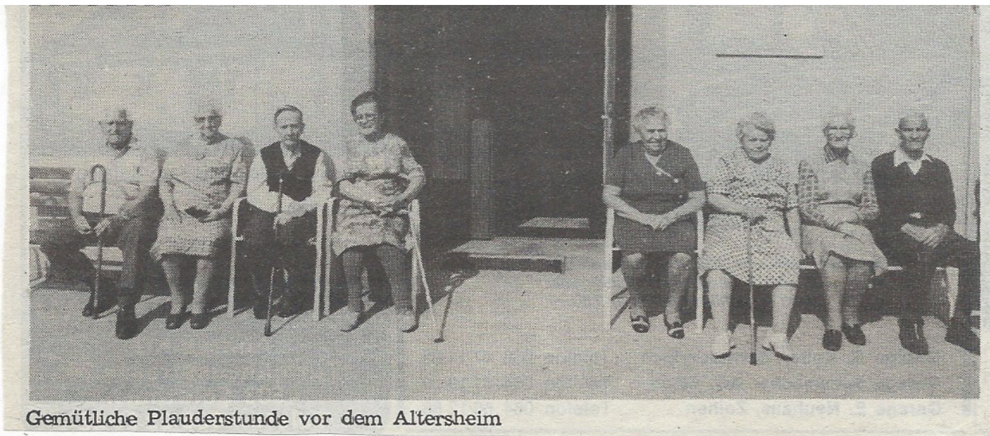
Gemütliche Plauderstunde vor dem Altersheim