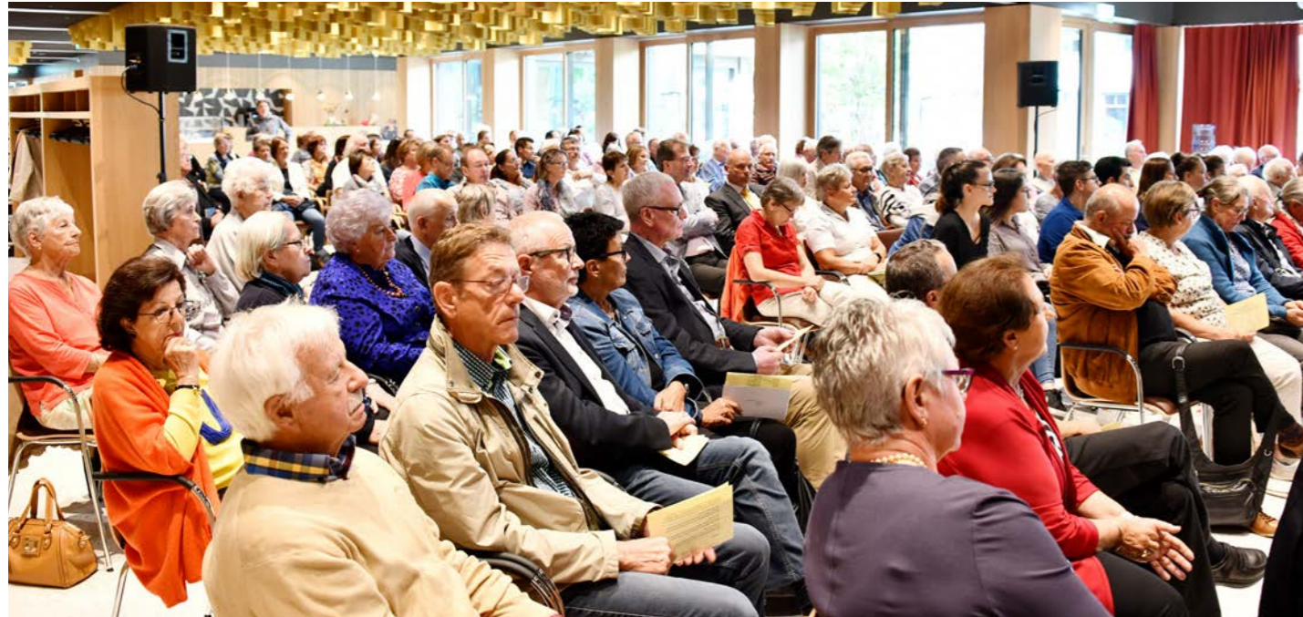
MIT 170 BESUCHERN MEHR ALS GUT GEFÜLLT - DER MEHRZWECKSAAL ERWEITERT UM DAS BISTRO

VEREIN EHEMALIGER BEZIRKSSCHÜLER AM 6. SEPTEMBER MIT RUND 170 TEILNEHMERN